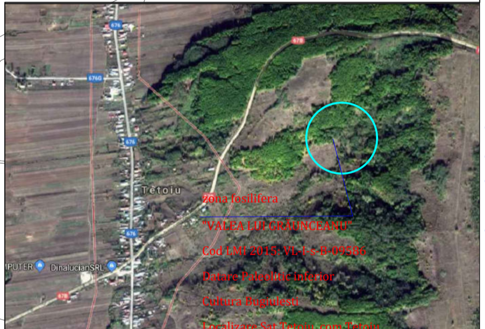
Imagine satelitară zona fosilifera "Valea lui Graunceanu", sat Tetoiu, comuna Tetoiu