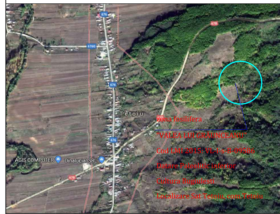
Imagine satelitară zona fosilifera "Valea lui Graunceanu", sat Teteiu, comuna Teteiu