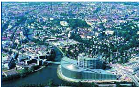
Parlamentul European (Strasbourg). Vedere generală

(Verts/ALE) cu 42 membri; - Grupul confederal al stângii unite Europene/Stânga Verde Nordica (GUE/NGL) cu 41 membri; - Grupul pentru Democrație și Independență (IND/DEM) cu 36 membri; - Grupul Uniunii pentru Europa Națiunilor (UEN) cu 27 membri; - Grupul celor neînscrși (NI) cu 30 membri. Parlamentul European mai numeste și un